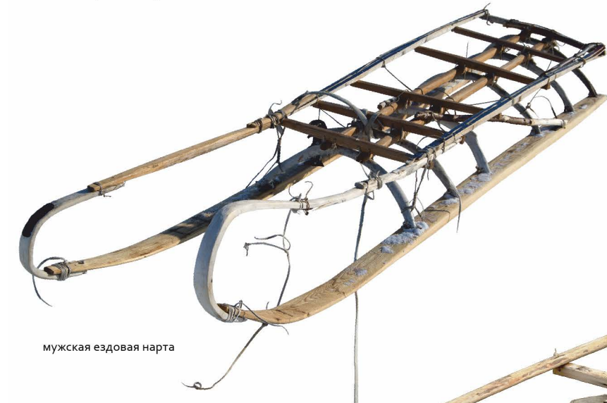
мужская ездочная нарта