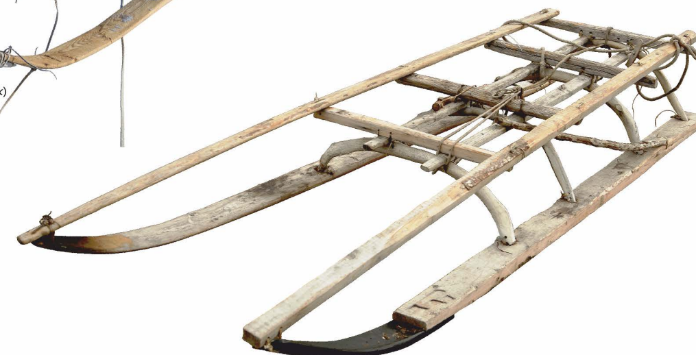
грузовая (тяжелая, среднетяжелая, легкая) нарта (репалькольгын)