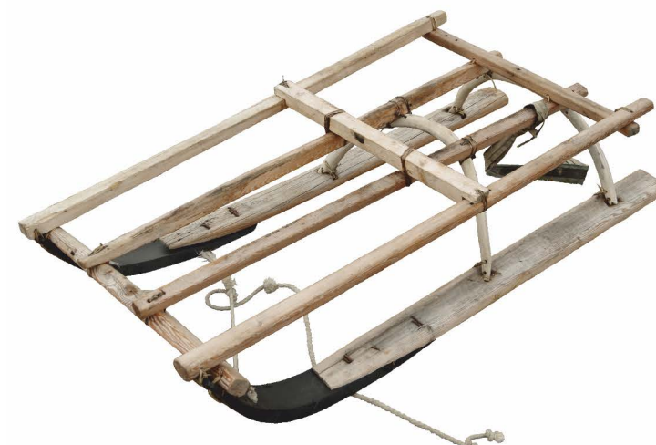
нарта для перевозки длинных шестов (товри релькине)