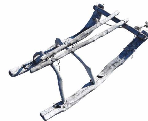
нарта для перевозки коротких шестов (варе релькине)