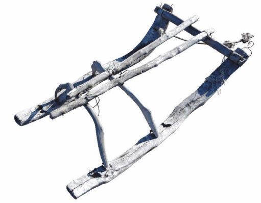
нарта для перевозки коротких шестов