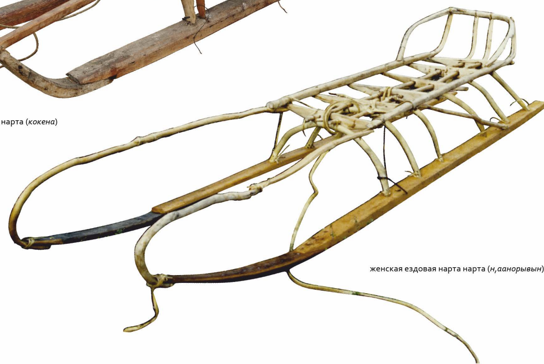
женская ездочая нарта нарта (н, аанорывын)