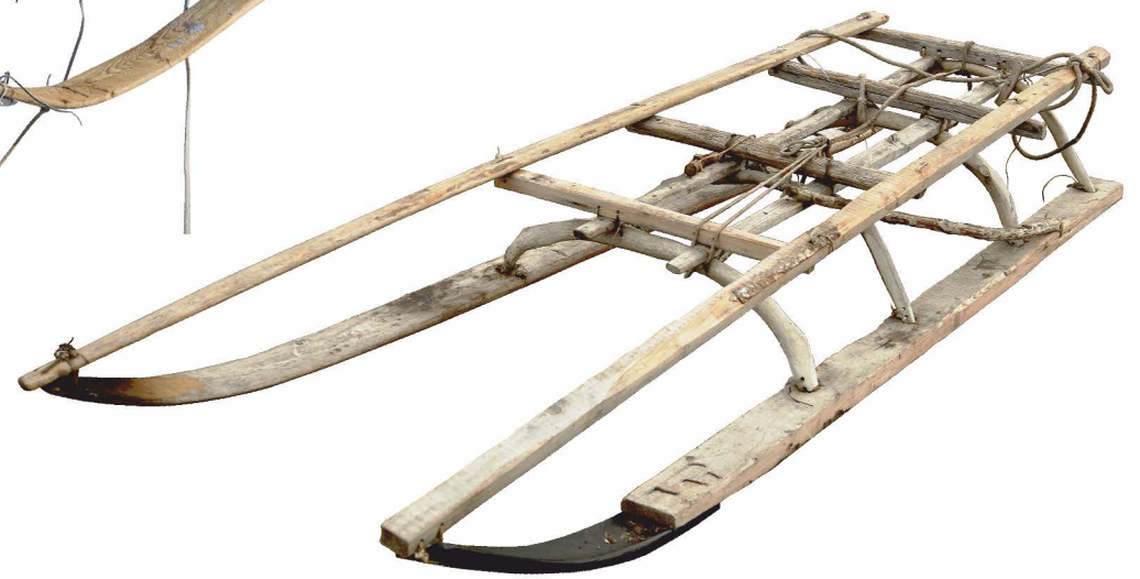
грузовая(тяжелая, средне-тяжелая, средне-тяжелая, легкая) нарта