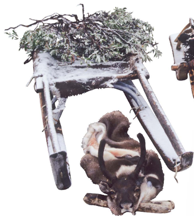
священная нарта (тайныквыёчгын)