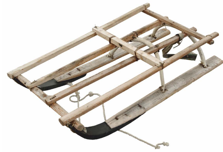
нарта для перевозки длинных шестов