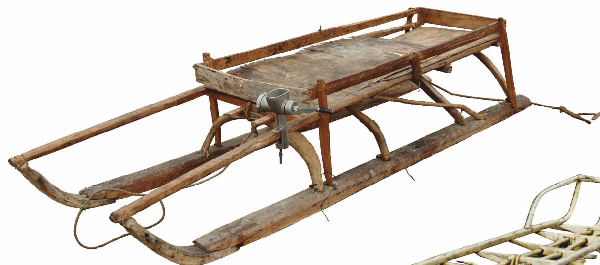
посудная нарта (кокена)